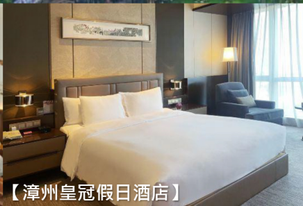
【漳州皇冠假日酒店】