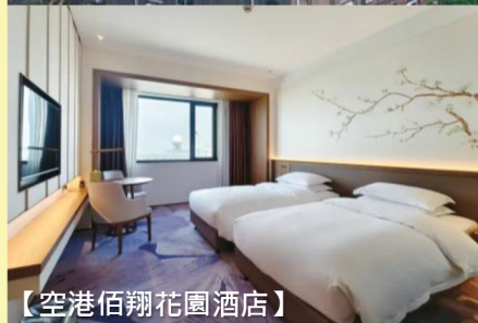
【空港佰翔花園酒店】