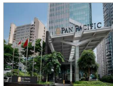
廈門泛太平洋酒店