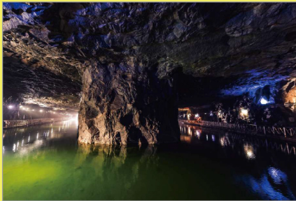
最美水上坑道【翟山坑道】