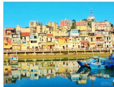
文青小店聚集地【沙坡尾】