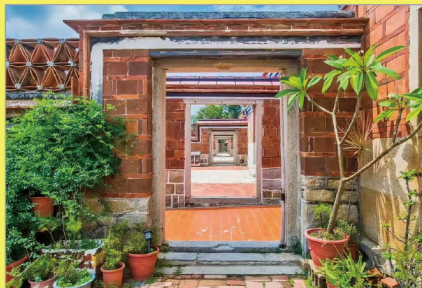
百年古厝聚落【山后民俗村】