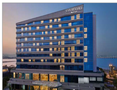
廈門百琪萬怡酒店