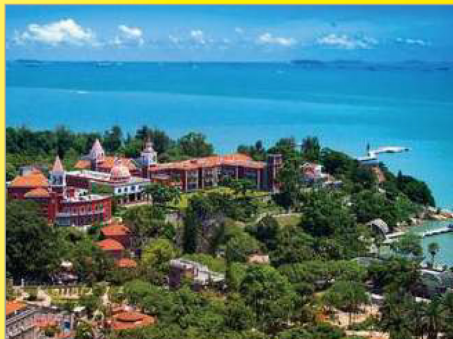
異國風情海上花園【鼓浪嶼】