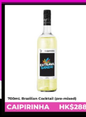
700ml. Brazilian Cocktail (pre-mixed) CAIPIRINHA HK$288