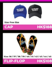
Size: Free Size CAP HK$188 Size: 36 / 37 / 38 / 39 / 40 / 41 / 42 / 43 / 44 / 45 FLIP-FLOP HK$108