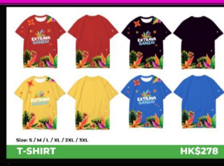
Size: S / M / L / XL / XXL / 3XL T-SHIRT HK$278