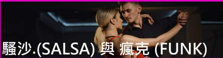
騷沙.(SALSA) 與 瘋克 (FUNK)