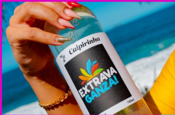
只此一家 巴西國民雞尾酒 Caipirinha