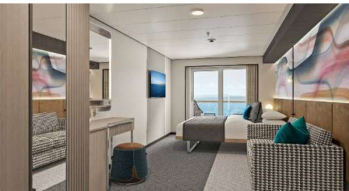
露台房(房間約 186/45 平方呎)