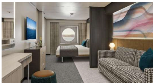
海景房(房間約 186 平方呎)