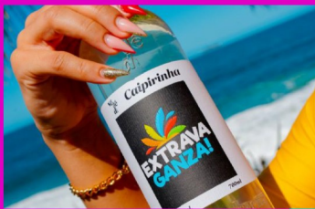
只此一家 巴西國民雞尾酒 Caipirinha