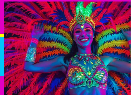
臉部 / 身體 彩繪體驗