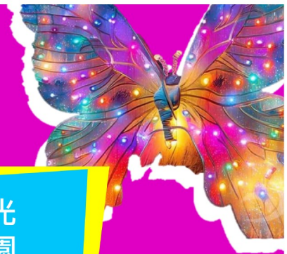
百米夜光 打卡花園