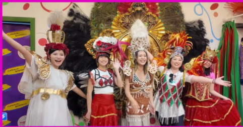
拉丁美洲 傳統服飾體驗