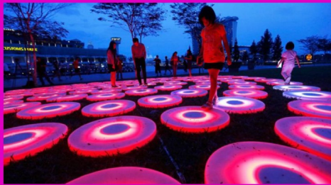
LED 發光重力 感應互動舞池