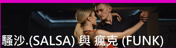
騷沙.(SALSA) 與 瘋克 (FUNK)