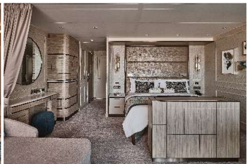
Silver Suite (49.7 sq.m., Incl. Veranda)