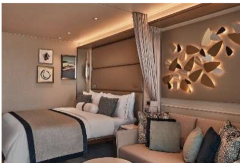
Deluxe Veranda Suite (33.1 sq.m., Incl. Veranda)