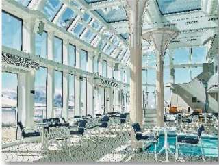
Pool Deck & The Grill