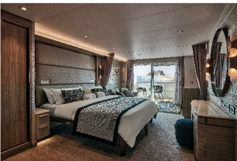
Classic Veranda Suite (33.1 sq.m., Incl. Veranda)