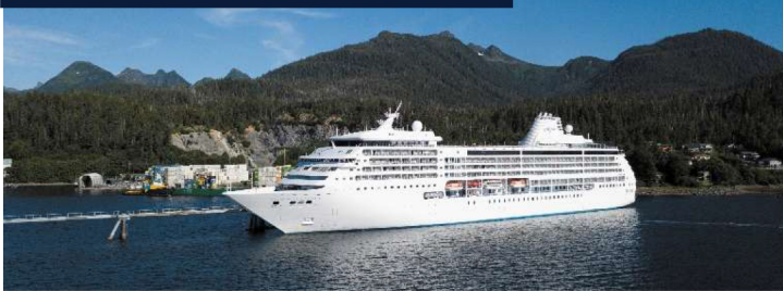
七海航行者號 Seven Seas Mariner

麗晶七海郵輪 Regent Seven Seas Cruises 一直以「最全面的奢華體驗 An Unrivaled Experience™」及「全包式航遊風格 The Most Inclusive Luxury Experience」聞名於郵輪界。