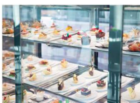
River Café 全天餐飲選擇小吃