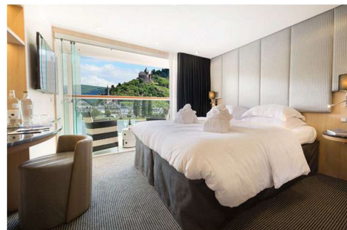
豪華陽台套房(Category BD) 225 平方公尺