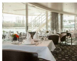
Portobellos /L' Amour 義大利、法國或葡萄牙美食