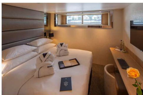
標準套房(Category E) 161 平方公尺