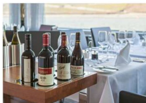
Crystal Dining 主餐廳