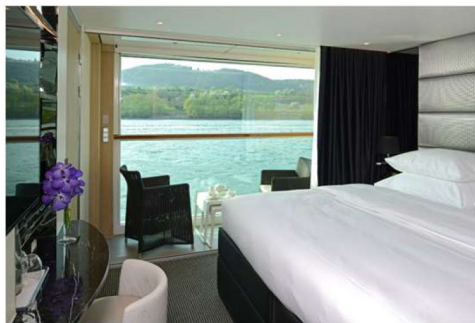
河景陽台套房(Category C/A) 205 平方公尺