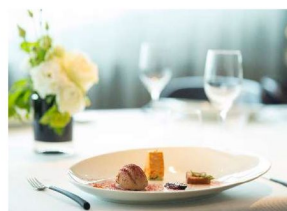
Table La Rive/ Table d'Or 10 位客人提供私密的用餐體驗