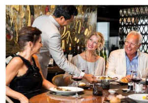
Chef's Table 10 道菜晚餐