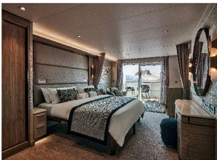
Classic Veranda Suite (33.1 sq.m., Incl. Veranda)