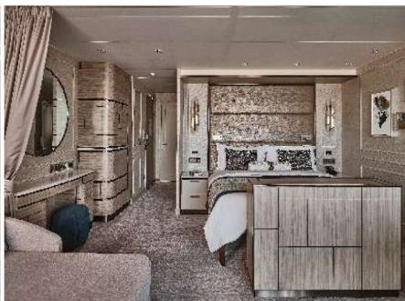
Silver Suite (49.7 sq.m., Incl. Veranda)