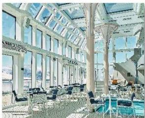
Pool Deck & The Grill