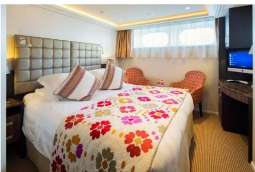
河景房 Category E/D (160 sq. ft.)

優雅的AmaLucia號是屢獲殊榮的AmaLea和AmaKristina的姊妹船，可容納 156 名乘客。這艘溫馨、舒適的遊輪提供奢華的空間，讓客人可以安靜地放鬆身心。從帶有雙陽台的舒適客艙（可讓客人透過娛樂點播、免費高速網路和Wi-Fi與外界保持良好聯繫）。當然，主餐廳和 The Chef's Table 特色餐廳提供的精緻美食將滿足您在AmaLucia上的每個渴望。