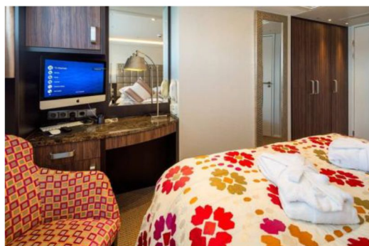
法式露台房 Category CB/CA (170 sq. ft.)