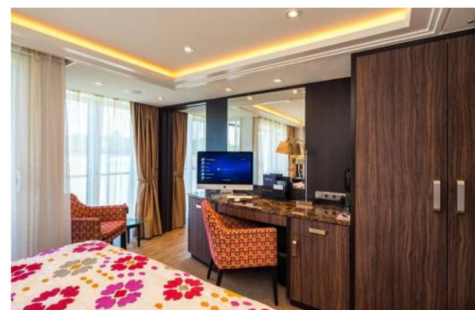
雙露台房 Category BB/BA (210 sq. ft.)