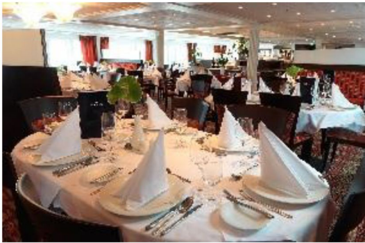
主餐廳 Main Restaurant

AmaCello 採用金色和橙色裝飾，繪製出歐洲絢麗的秋葉，是一場漂浮的愉悅。美麗的陽光甲板上設有舒緩的漩渦浴池、巨型棋盤和躺椅，讓您欣賞非凡的風景。飯店內，美麗的主餐廳和 The Chef's Table 特色餐廳飄出誘人的香氣，每間餐廳均提供由專業廚師使用新鮮的當地食材精心製作的菜餚。只要咬一口，您就會明白為什麼AmaCello像我們所有的歐洲船隻一樣，被納入國際知名烹飪協會 La Chaîne des Rôtisseurs ！大多數客艙都符合法式主題，設有法式陽台以及點播娛樂、恆溫空調和室內保險箱等設施。這艘令人難以置信的河船上還設有健身室、桑拿浴室和按摩室供您享用。