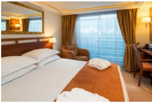
法式露台房 Category C/B (170 sq. ft.)