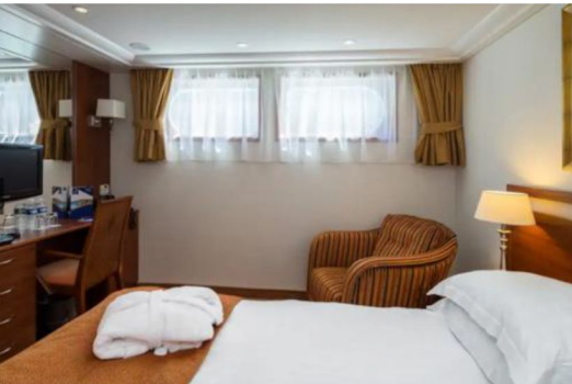
河景房 Category E/D (170 sq. ft.)

郵輪雜費約: HK$ 1,900 | 以上航程及船公司安排之指定岸上觀光活動只供參考，一切資料皆以船公司最後公佈為準，如有更改恕不另行通知。