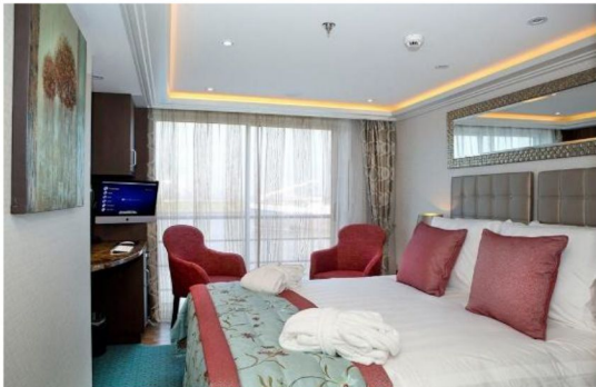
法式露台房 Category CB/CA (155-170 sq. ft.)