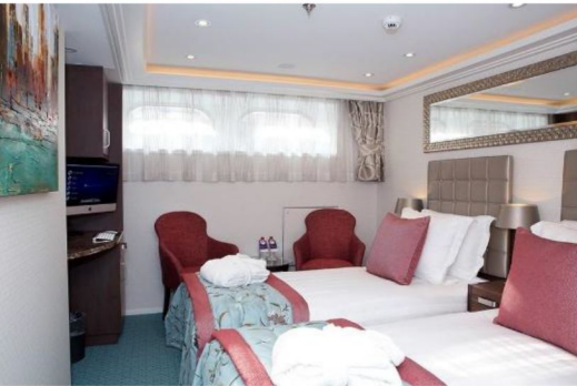
河景房 Category E/D (160 sq. ft.)

AmaReina/Sonata 感受到皇室般的感覺。令人愉悅的調色板搭配微妙的花卉和葉子設計，帶您進入戶外令人驚嘆的風景。您的宮殿擁有大量公共空間。主酒廊配有小型三角鋼琴，是優雅的縮影，也是小酌一杯的浪漫場所。您還可以在主餐廳和主廚餐桌上找到適合國王和王后的精緻美食，並為您提供多道菜的品嚐菜單。其他豪華設施包括步道、溫水游泳池、健身房、按摩和美髮沙龍以及特色咖啡站。