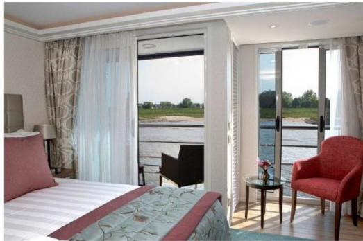
雙露台房 Category BB/BA (210 sq. ft.)