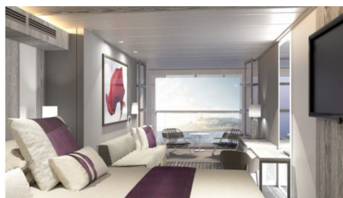
Edge Staterooms with Infinite Verandas SM

曾負責設計杜拜帆船酒店的英籍名建築設計師 Tom Wright，獲邀為郵輪設計的 Magic Carpet 。這是個設於船邊的大型可升降平臺，當 2 樓、5 樓、14 樓及 16 樓停泊，變身戶外甲板、泳池區的延伸、接駁艇等候區域，或變成無邊際海景餐廳等不同功能，成為海上魔氈。