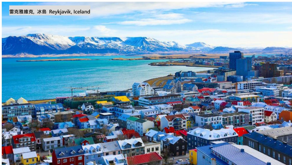
雷克雅維克, 冰島 Reykjavik, Iceland