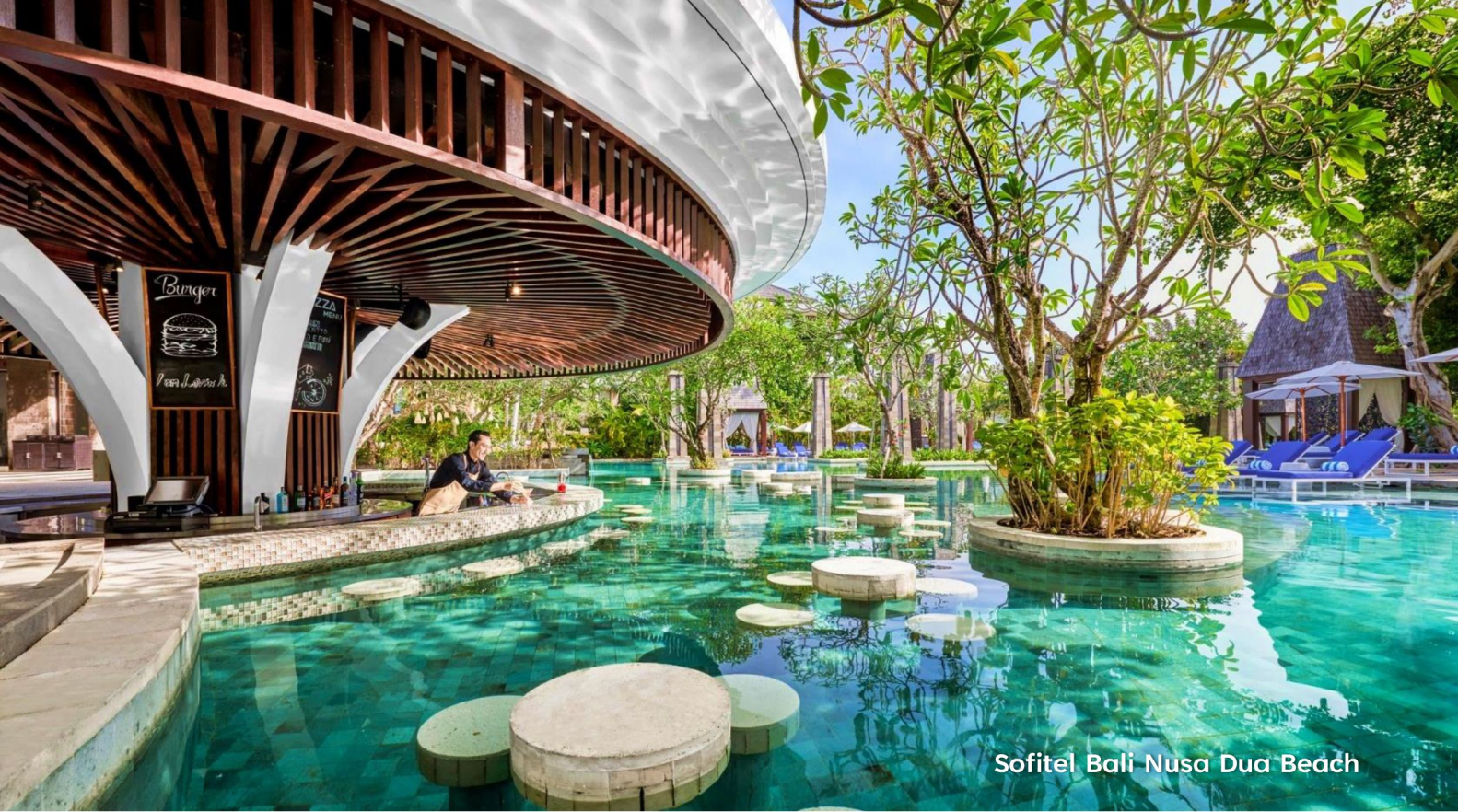
Sofitel Bali Nusa Dua Beach