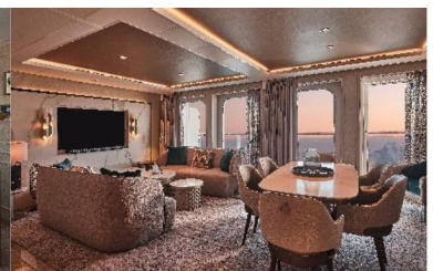
Grand Suite (155 sq.m., Incl. Veranda)