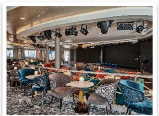
船上 Explorer Lounge