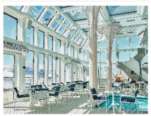
Pool Deck & The Grill