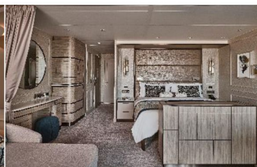
Silver Suite (49.7 sq.m., Incl. Veranda)