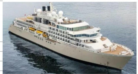
Silver Endeavour 銀海奮進號

總噸位 Gross tonnage: 20,449 噸 tons 首航年份 Inaugural: 2021 年 載客 Passengers: 220 人 船員 Crew: 200 人