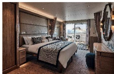
Classic Veranda Suite (33.1 sq.m., Incl. Veranda)