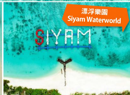
漂浮樂園 Siyam Waterworld