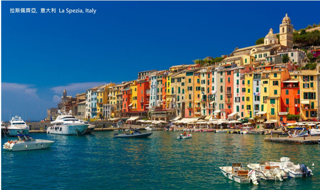
拉斯佩齊亞, 意大利 La Spezia, Italy