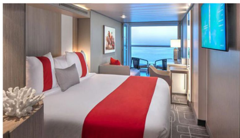
Edge Staterooms with Infinite Veranda

曾負責設計杜拜帆船酒店的英籍名建築設計師 Tom Wright，獲邀為郵輪設計 Magic Carpet。這是個設於船邊的大型可升降平台，當在 2 樓、5 樓、14 樓及 16 樓停泊，變身戶外甲板、泳池區的延伸、接駁艇等候區域，或變成無邊際海景餐廳等不同功能，成為海上魔氈。