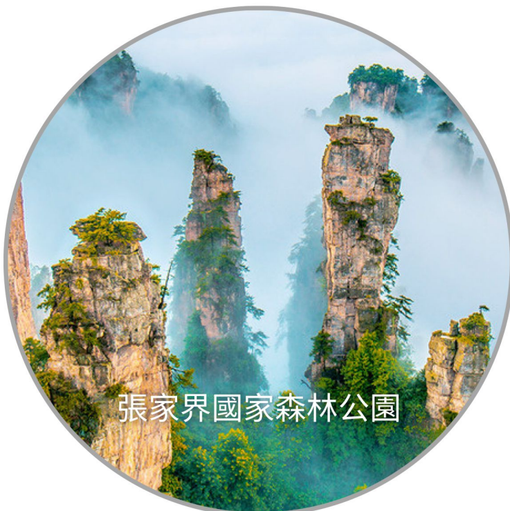
張家界國家森林公園