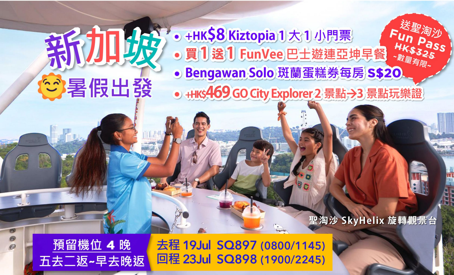
聖淘沙 SkyHelix 旋轉觀景台