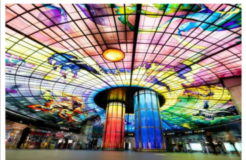
細意安排全日自由活動