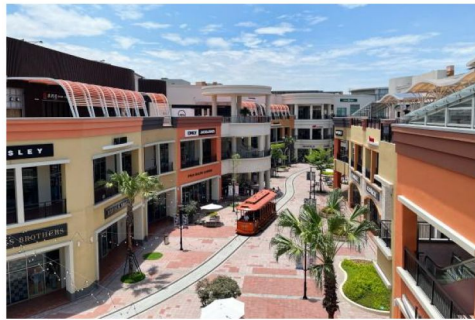
高雄草衙SKM Park Outlets購物中心