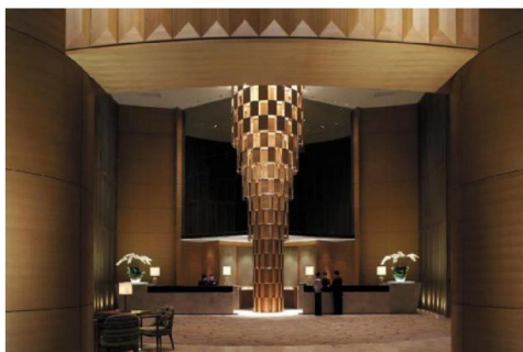
國際品牌五星級：遠東香格里拉酒店