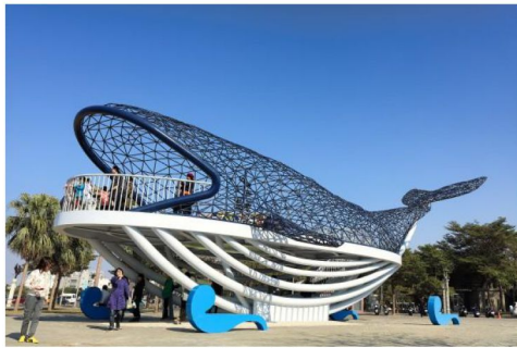
鯨魚裝置藝術【大魚的祝福】