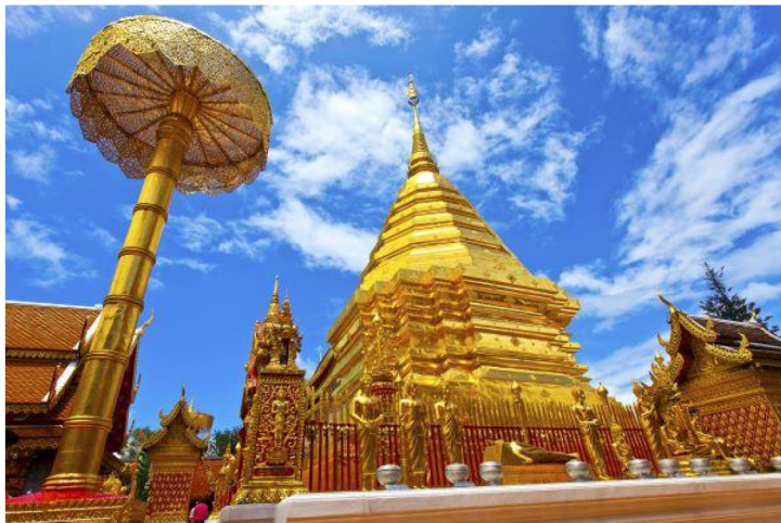
【清邁】素貼山、雙龍寺 (包登山纜車)