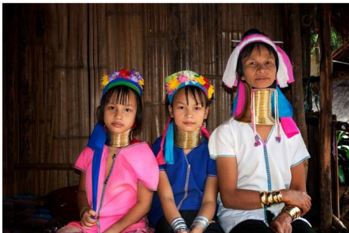
【清邁】探訪神秘長頸族村