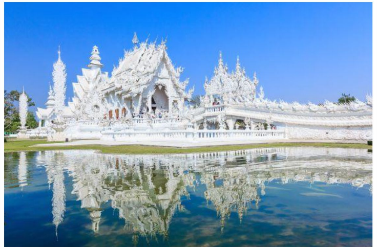
【清萊】龍坤藝術廟『又稱：白廟』 (包門票)