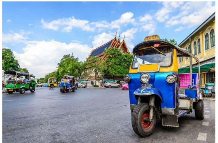
【清邁】乘嘟嘟車遊清邁古城