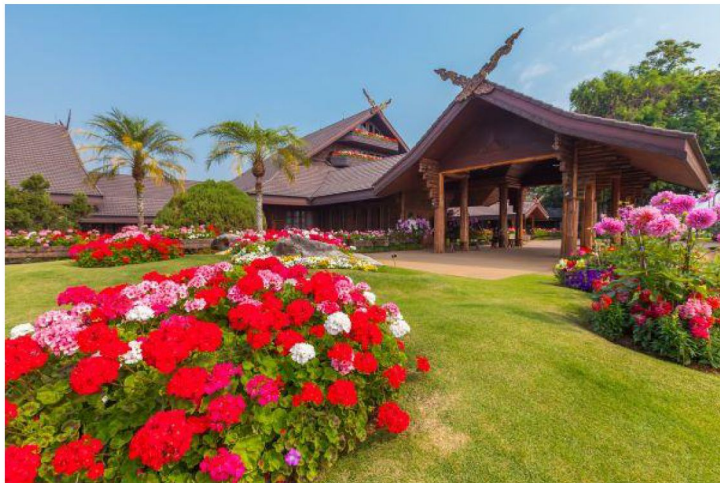
【清萊】黎洞皇太后夏日行宮