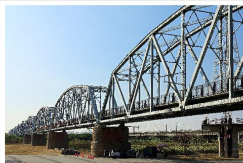
【大樹舊鐵橋天空步道】