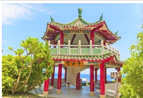
小琉球美人洞【望海亭】