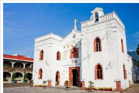
【萬金聖母聖殿】 擁有150年歷史的三級古蹟教堂