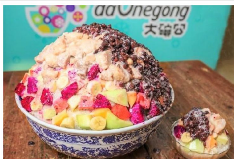
休閒小吃: 品嚐高雄特色大碗公冰