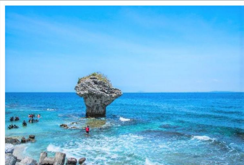
小琉球超美海景【花瓶岩】