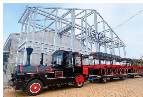
特別安排乘搭高港小火車 沿途觀賞高雄港開闊港景