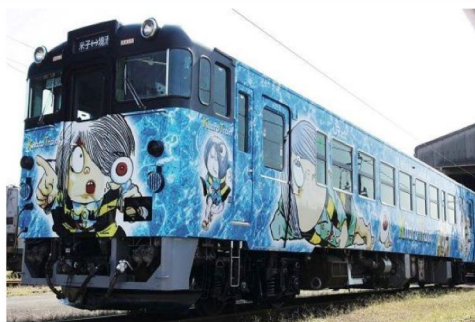
乘坐鬼太郎妖怪或 柯南偵探漫畫特色列火車