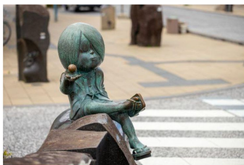
800公尺177座銅像開心街