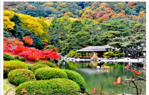
栗林大名(將軍)庭園