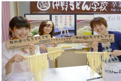
烏冬學校開心體驗製作烏冬