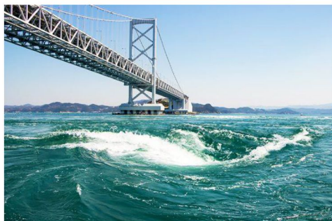
鳴門大橋漩渦奇趣走廊