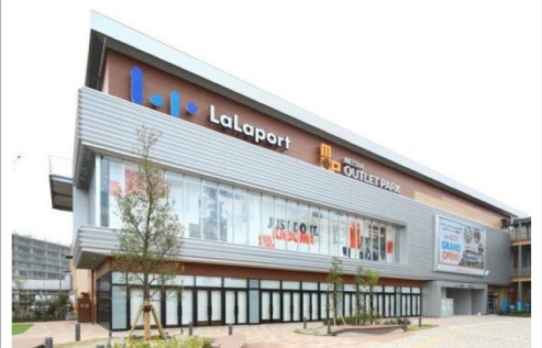
門真三井OUTLET/ LALA PORT購物城