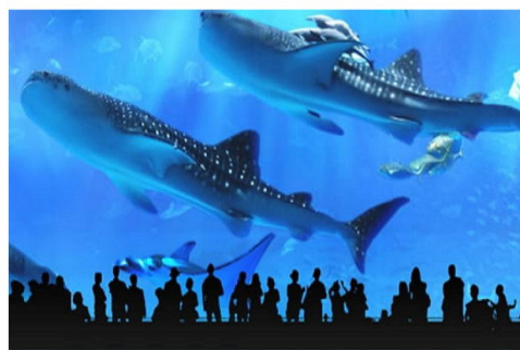
全亞洲最大沖繩海洋博水族館