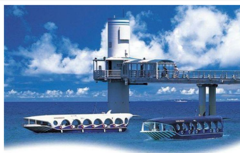
BUSENA海中公園、海中展望塔、 玻璃底遊艇