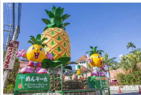
菠蘿樂園趣緻菠蘿車