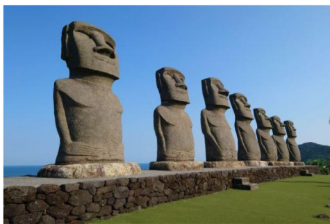
世界遺產復活節島巨石像