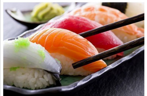
壽司DIY創作後,自己享用