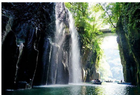
世外桃源高千穗峽瀑布