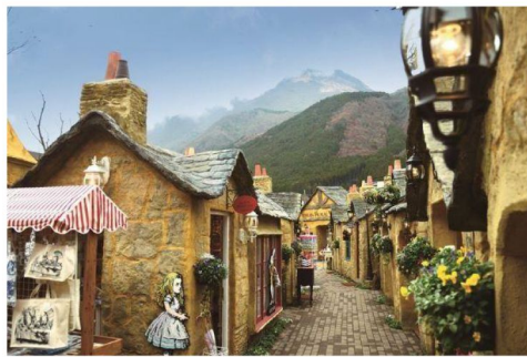
湯布院懷舊古典街 FLORAL VILLAGE