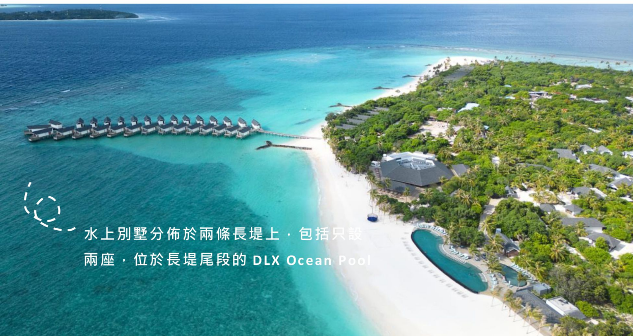
水上別墅分佈於兩條長堤上，包括只設兩座，位於長堤尾段的 DLX Ocean Pool