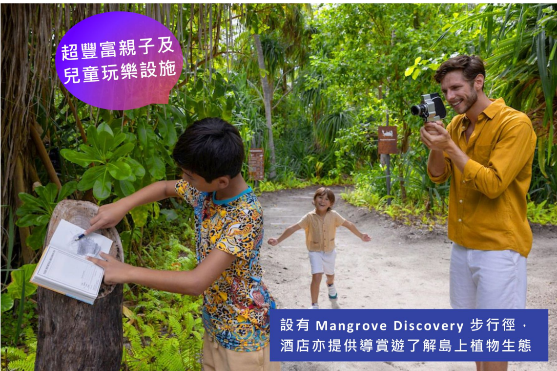
超豐富親子及 兒童玩樂設施