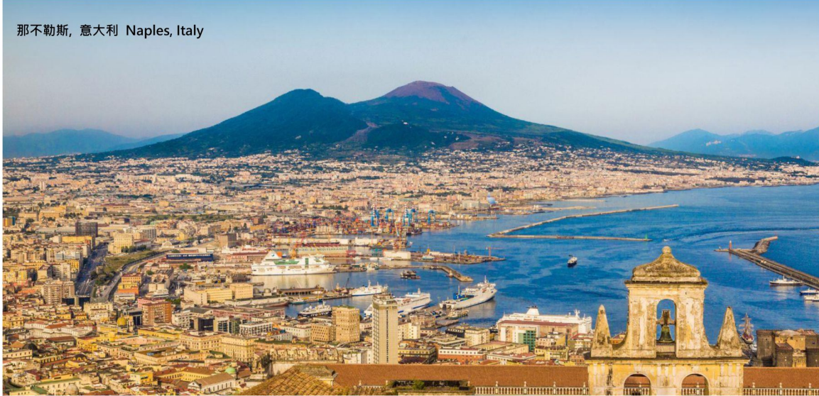
那不勒斯, 意大利 Naples, Italy