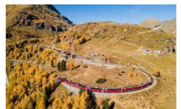
Bernina Express 伯爾尼納快車