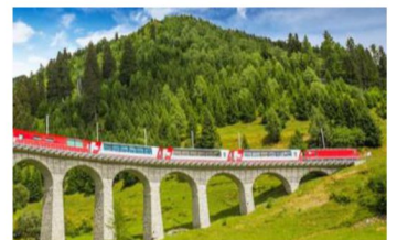
Glacier Express 冰河快車