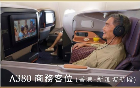
A380 商務客位 (香港 - 新加坡航段)