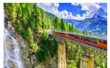
Gornergrat 高納葛拉特齒軌火車