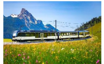
黃金列車 GoldenPass Panoramic