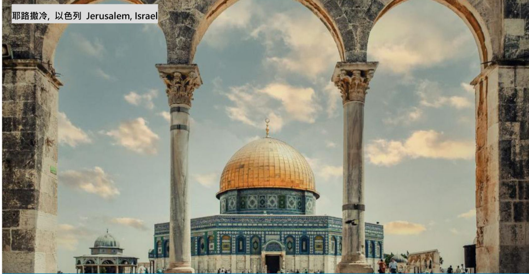
耶路撒冷, 以色列 Jerusalem, Israel