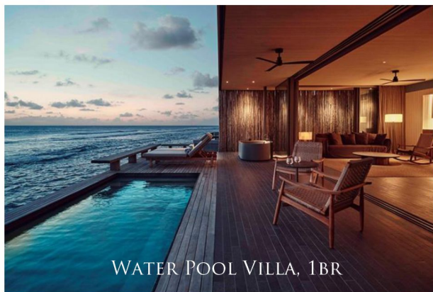
WATER POOL VILLA, 1BR