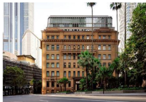
CAPELLA SYDNEY 已於 2023 年 3 月開幕，由歷史建築改建

備註：套票為最少 2 位成人成行；必須全程同行及一同辦理登機手續。航班編號、時間及/或機種如有更改，將不另行通知。以上價格未包機票稅項、燃油附加費、機位級別提升附加費。以上酒店星級及房種資料只供參考。香港旅遊業議會建議旅客出發前按個人需要購買綜合旅遊保險。訂位時需繳付不設退款之套票全費，有關費用只會於機位或酒店未能確定時方獲退還。已確定之機票及酒店套票，如須更改或取消，須按實際出票日期之機票及酒店相關條款而定。價目及細則如有任何更改，恕不另行通知。