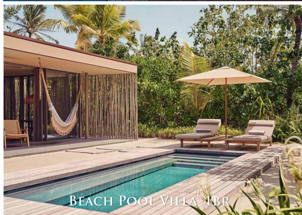
BEACH POOL VILLA, 1BR