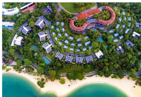
CAPELLA SINGAPORE 新加坡首屈一指豪華度假村