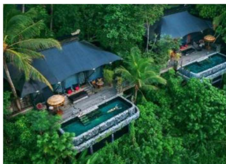
CAPELLA UBUD 坐落於峇厘島烏布的隱世桃源