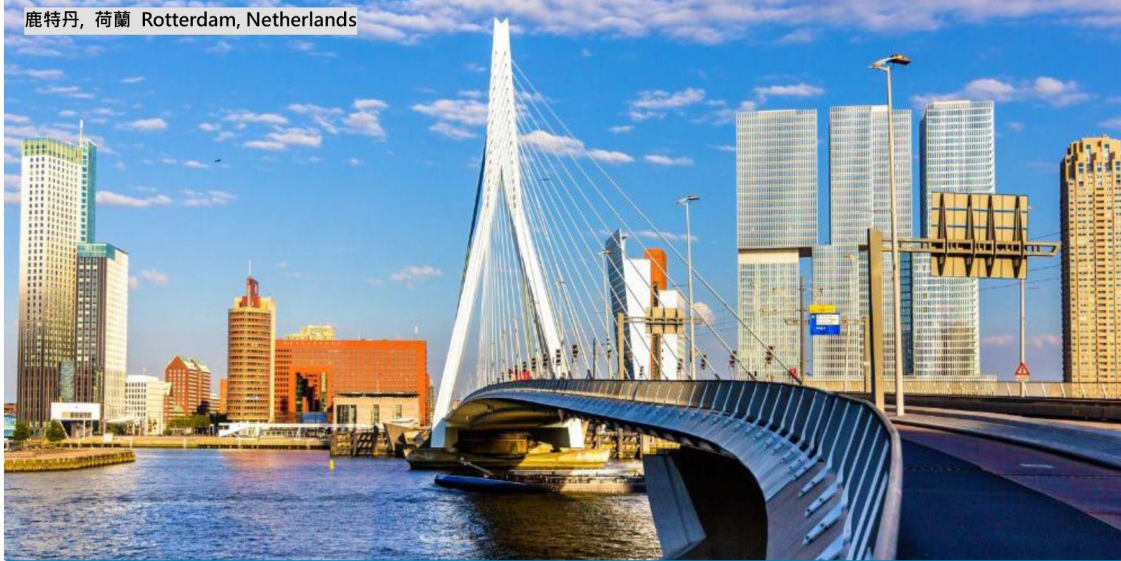
鹿特丹, 荷蘭 Rotterdam, Netherlands