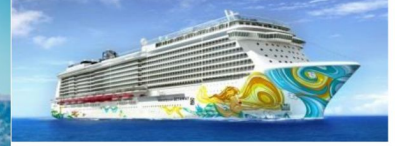
NORWEGIAN CRUISE LINE®