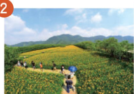
2 頭社活盆地 來跟大地一起跳舞