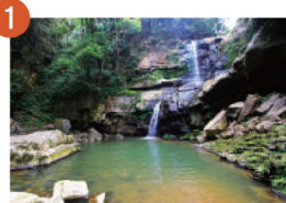
1 澀水水上瀑布 充滿原始風情的溪谷

到日月潭旅遊打卡正夯，想要玩遍日月潭周邊景點，不如就從網美們都推薦的十大景點開始吧！無論是文青造景、踏青健行及天然美景這裡都有，新鮮好玩多樣的日月潭一日遊路線，歡迎大家按圖索驥一起去玩吧！