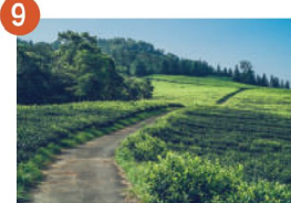
9 魚池茶園美景 悠閒漫步紅茶莊園