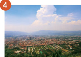
4 埔里虎頭山 遠眺小鎮夕照的景致