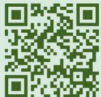
日月潭好行主題網

電動天鵝船、獨木舟、SUP立式划槳 地點：伊達邵碼頭、水社北旦碼頭 營業時間：08:30-17:30 南投縣日月潭水上觀光遊憩發展協會 客服專線：0919-005723