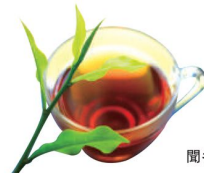
聞名遐邇的魚池紅茶

埔里鎮的各宗教寺廟的數量、密度位居全台之冠，是當地一大特色；中台禪寺、地母廟等都是信仰中心。