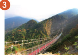
3 雙龍七彩吊橋 情侶最佳約會美地