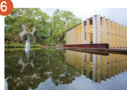
6 桃米社區 蛙鳴蝶舞的天籟之音