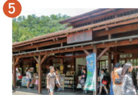
5 車埕小鎮 古早車站的風華歲月