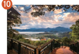
10 金龍山雲海 風起雲湧的日出曙光