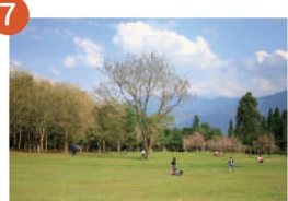
7 暨南國際大學 漫步綠意的美麗校園