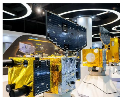
深圳市航天科普教育基地