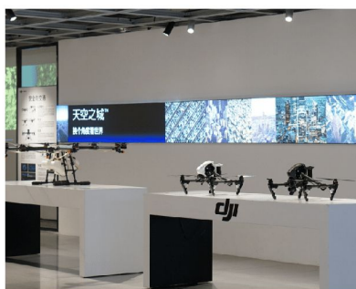
大疆教育體驗中心