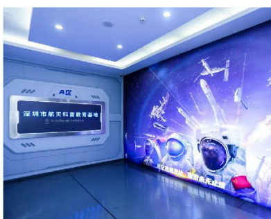
深圳市航天科普教育基地