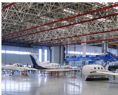
愛飛客航空科普基地