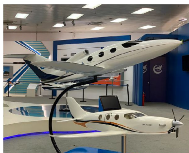
愛飛客航空科普基地