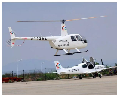
愛飛客航空科普基地