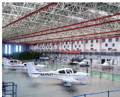
愛飛客航空科普基地