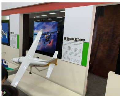
愛飛客航空科普基地