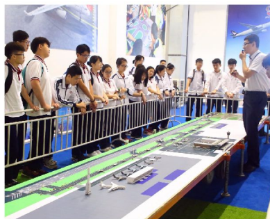
愛飛客航空科普基地