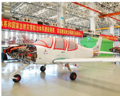
愛飛客航空科普基地