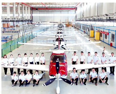
愛飛客航空科普基地