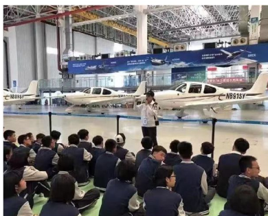
愛飛客航空科普基地