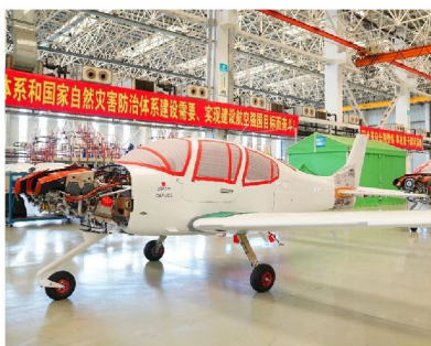
愛飛客航空科普基地