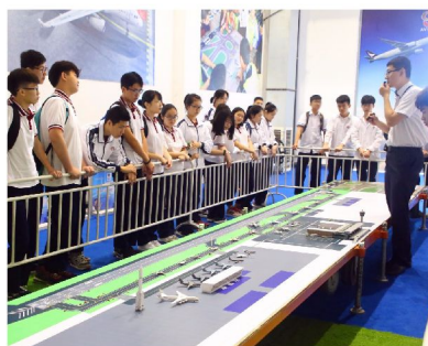
愛飛客航空科普基地