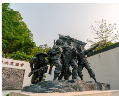
廣東東江縱隊紀念館