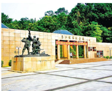
廣東東江縱隊紀念館