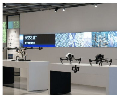
大疆教育體驗中心