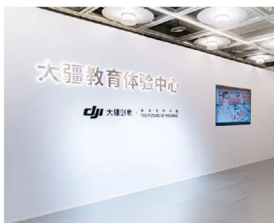
大疆教育體驗中心