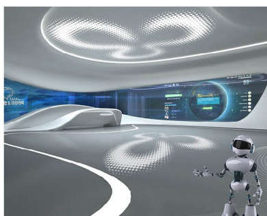
深圳智慧生活創想館