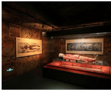
非物質文化遺產保護展廳