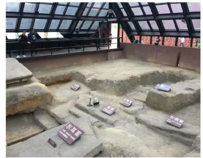
非物質文化遺產保護展廳