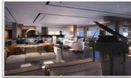
船上以深色為主調，配合大海的藍色，彰顯出遊艇的氛圍