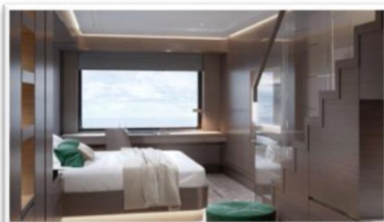
The Loft (700 SQ FT / 65 SQ M) 複式套房設計。