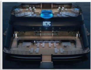
船上特設無邊際泳池