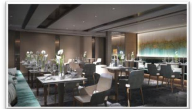
由米芝蓮 3 星級主廚主理餐單的 S.E.A.

全船共設 149 間露台套房，設計皆秉承 The Ritz-Carlton 的現代典雅氣派，採用了其木系色調的配搭，讓你尤如置身 The Ritz-Carlton 酒店住宿一般的海上旅程。