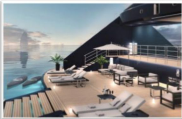
船尾水上活動平台 Marina