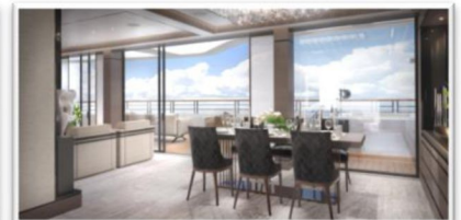
The Owners Suite (1098 SQ FT / 102 SQ M)