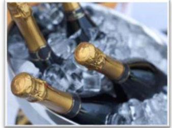
船上無限量享用指定酒水