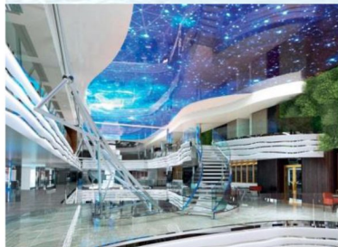
擁有半 LED 天幕的船中大道

MSC World Europa 上除了 6 個游泳池外，更設有一個地中海郵輪船隊中最大型的水上樂園，當中加入了 VR 虛擬技術更添樂趣。船上亦擁有多達 13 個餐膳選擇，除了 4 間主餐廳及自助餐廳外，加入了另外 6 間特色餐廳，包括美式扒房、壽司吧及日式鐵板燒。