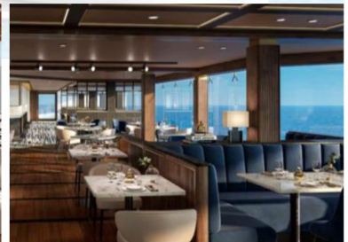
La Brasserie 自助餐廳