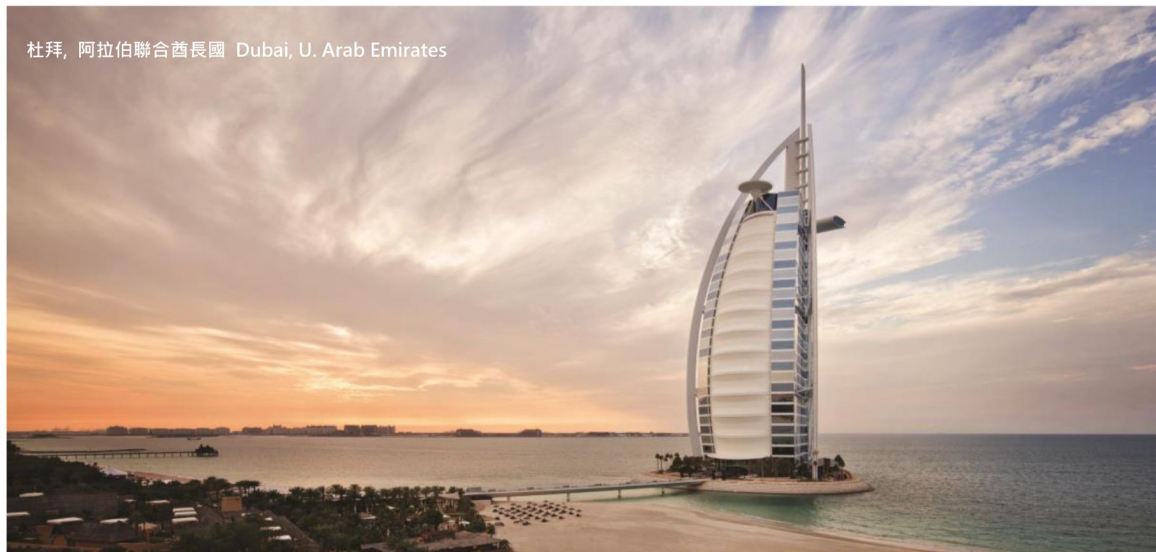
杜拜, 阿拉伯聯合酋長國 Dubai, U. Arab Emirates