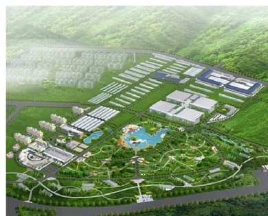
廣州國家農業科技園區