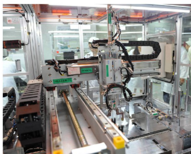
惠州信息科技產業基地