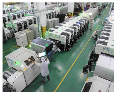
惠州信息科技產業基地