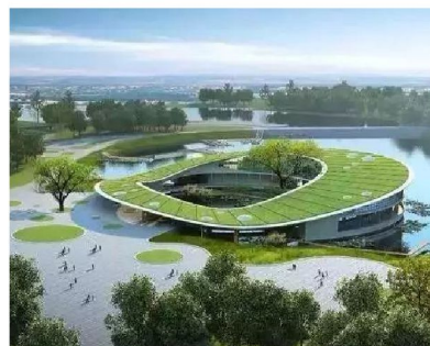
惠州潼湖生態智慧區