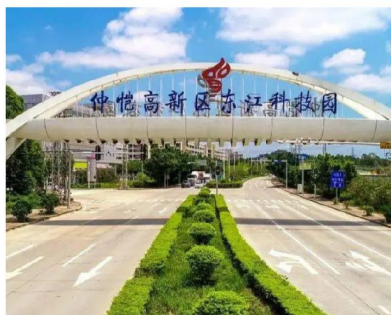
仲愷高新技術產業開發區