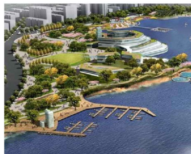
仲愷高新技術產業開發區