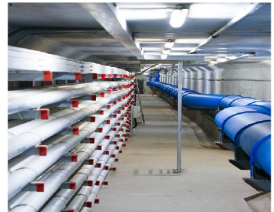
橫琴新區地下管道