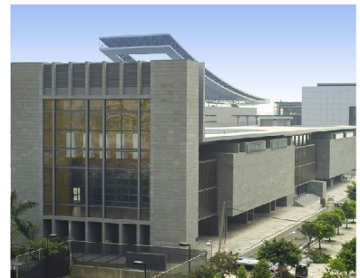
澳門回歸賀禮陳列館