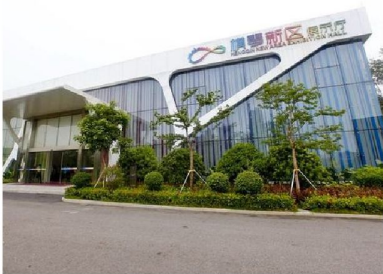
橫琴新區規劃建設展示廳