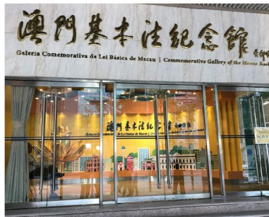
澳門基本法紀念館