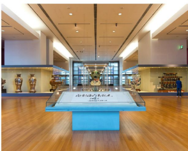
澳門回歸賀禮陳列館