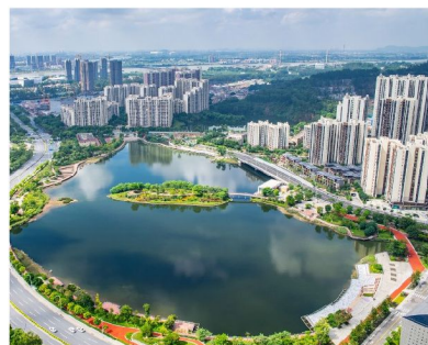
南沙的發展機遇和粵港合作