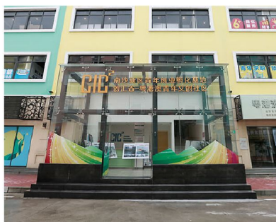
創匯谷粵港澳青年文創社區