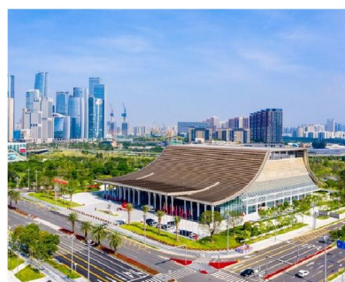
前海區內基礎建設