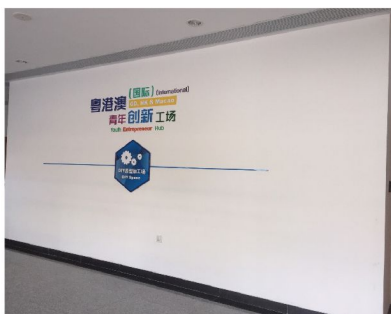
南沙粵港澳青年創新工場