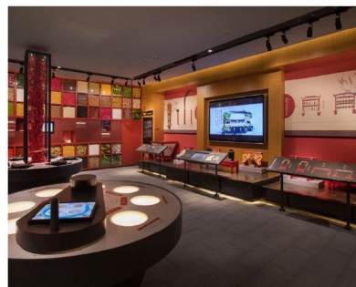
天心非物質文化遺產展示中心