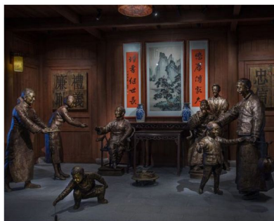
天心非物質文化遺產展示中心