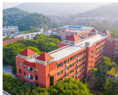
湖南師範大學附屬中學