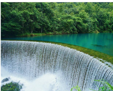
荔波大小七孔自然生態景區