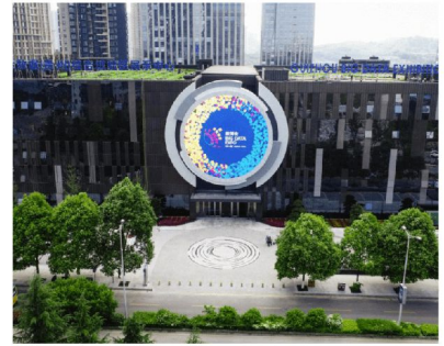
貴州大數據應用展示中心