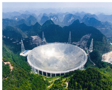
「中國天眼」FAST射電望遠鏡