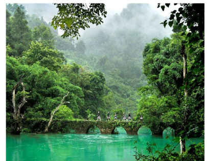
荔波大小七孔自然生態景區