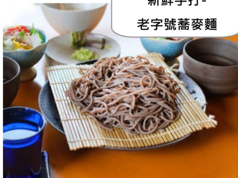
新鮮手打- 老字號蕎麥麵