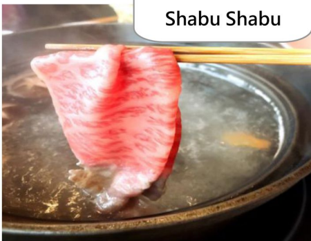
和牛 Shabu Shabu