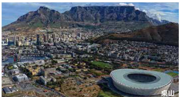
Table Mountain ~ V & A Victoria Shopping Mall

早餐後專車往機場乘內陸客機飛往南非最美麗城市一開普頓。抵達後即乘遊覽車往著名的駝鳥園，及參觀園內的小型博物館，並了解飼養駝鳥過程，同時可嘗試騎駝鳥。午餐於園內品嚐駝鳥肉餐後驅車前往纜車站轉乘最新旋轉吊車，登上高聳入雲，外型平如桌面的桌山，觀賞全市景色，遠眺大西洋海岸無盡景緻，忘盡煩憂(若因天氣或維修影響而停開吊車，將改遊覽訊號山取代)。繼往具歐陸色彩及以購物娛樂集於一身的V&A維多利亞海濱娛樂城遊覽。遊畢返回開普頓市區。