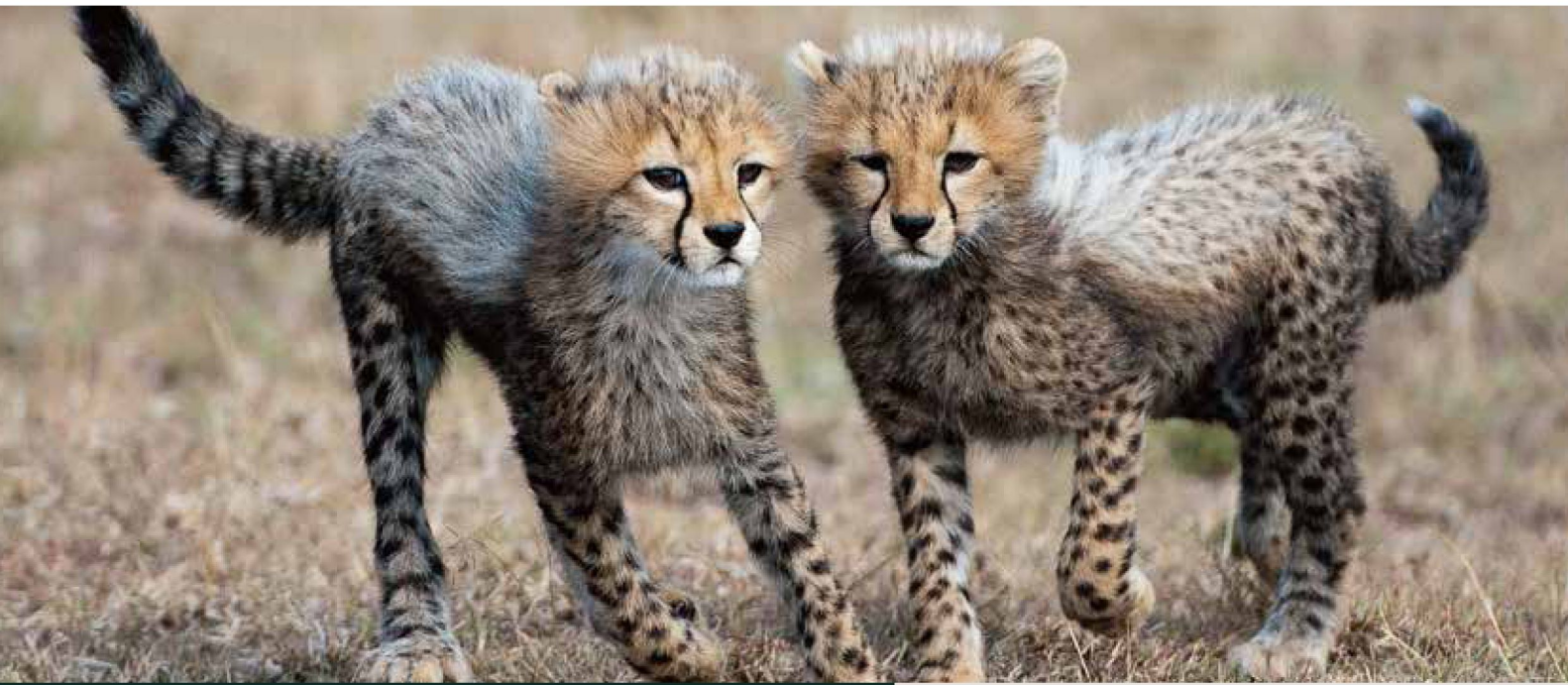
比林斯堡野生動物區