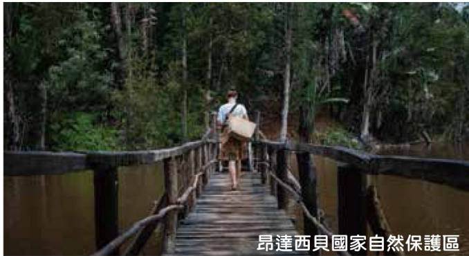
昂達西貝國家自然保護區

早餐後前往機場乘航機返回首都，抵達後，出發前往距離首都130公里的國家公園—昂達西貝國家自然保護區Parc National Andasibe。途中先經過莫拉芒加Moramanga午餐，餐後來到私人保護區—蝴蝶公園Parc Extique參觀。該園區以飼養了衆多馬達加斯加獨特的兩爬動物和昆蟲而出名，形形色色的變色龍和那些超乎你想像的蜥蜴、昆蟲等奇特的生物，一定會讓你大開眼界。此外，運氣好的話，還能在這裡的森林裡見到傳說中的Dancing Lemur跳舞狐猴，滑稽之極，非常有趣。傍晚抵達昂達西貝國家自然保護區。